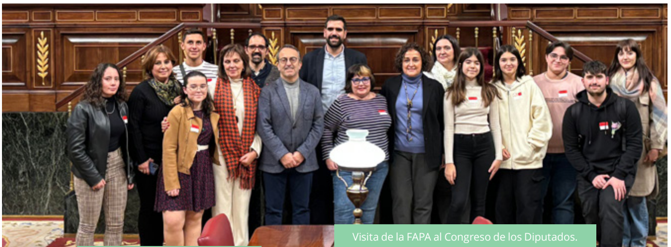
Visita de la FAPA al Congreso de los Diputados.

en colaboración con otras entidades relacionadas con el trastorno de la ludopatía y la salud mental. Desde 2019 han visibilizado y expuesto públicamente la situación y han comparecido en sede parlamentaria regional, lo que impidió que se aprobara un decreto ley que permitiera más laxitud en la instalación de tragaperras. La FAPA también ha dado charlas y ha participado en mesas redondas, exponiendo la grave situación, y recientemente representantes de la Federación han viajado como invitados al Congreso de los Diputados a proponer cambios que se elaborarán en los próximos meses.