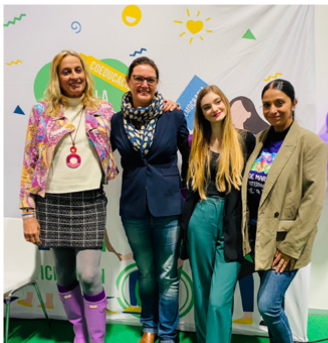
Las participantes en la mesa sobre igualdad celebrada el 8M.