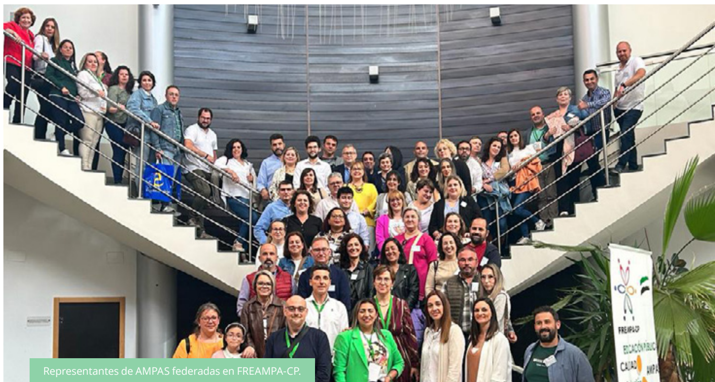
Representantes de AMPAS federadas en FREAMPA-CP.