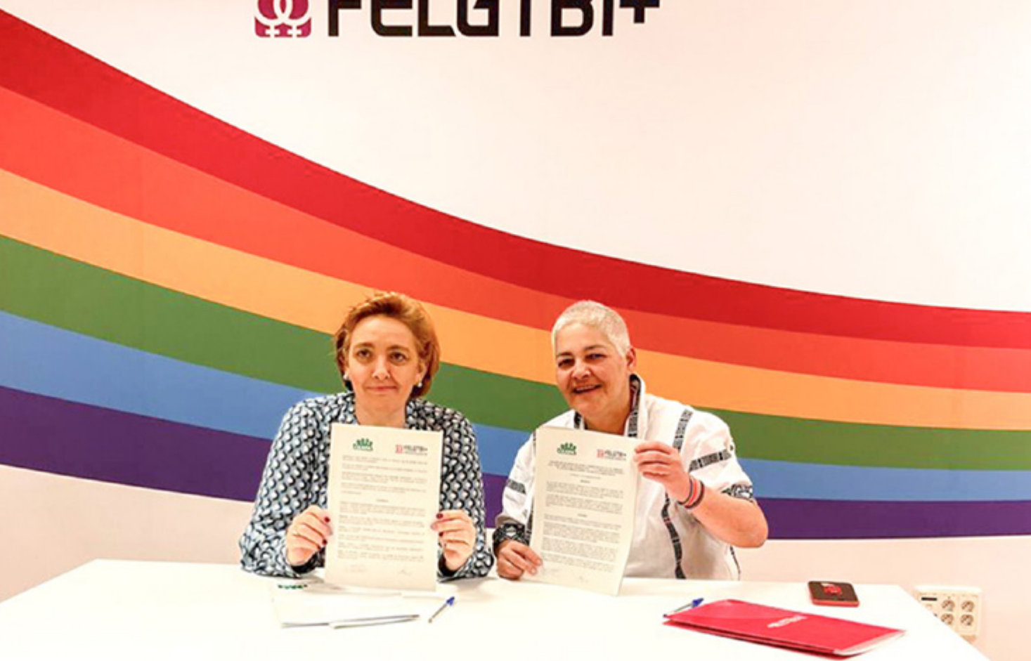
Las presidentas de CEAPA y de la Federación LGTBI+ tras la firma del convenio.