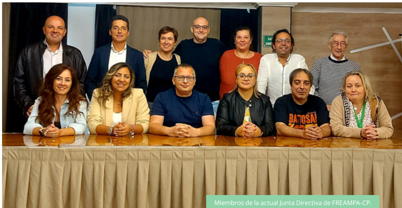
Miembros de la actual Junta Directiva de FREAMPA-CP.

Como consecuencia de este incansable trabajo y atendiendo al artículo 2 de sus estatutos, y concretamente al fin segundo: "Impulsar, orientar, ayudar, coordinar y representar a las AMPA, en orden a la defensa y ejercicio de sus derechos y al mejor cumplimiento de sus deberes", son muchas las actividades que se realizan desde FREAMPA-CP desde el inicio de su andadura.