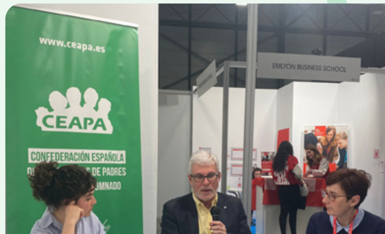
Mesa redonda sobre salud mental celebrada en Ifema.