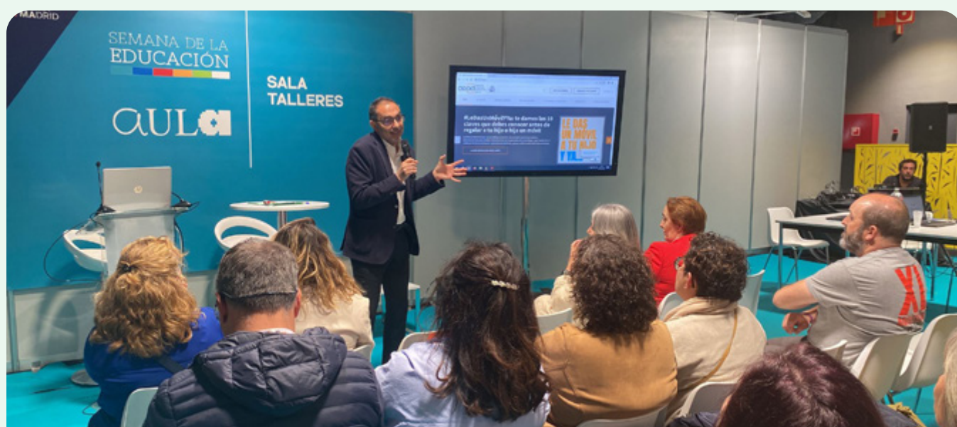
La AEPD presentó a CEAPA la campaña 'Un móvil es más que un móvil'.

de orientación de los centros y el profesorado en general van buscando nuestros materiales (cuentos, guías, dípticos...) porque nos transmiten que son muy buenos para trabajar con el alumnado”, señaló la presidenta. Este año, entre otras actividades, se celebró una mesa redonda sobre salud mental en los niños, niñas y adolescentes o un taller sobre la gestión del uso del móvil impartido por la Agencia de Protección de Datos con la colaboración del Consejo Escolar de Estado.