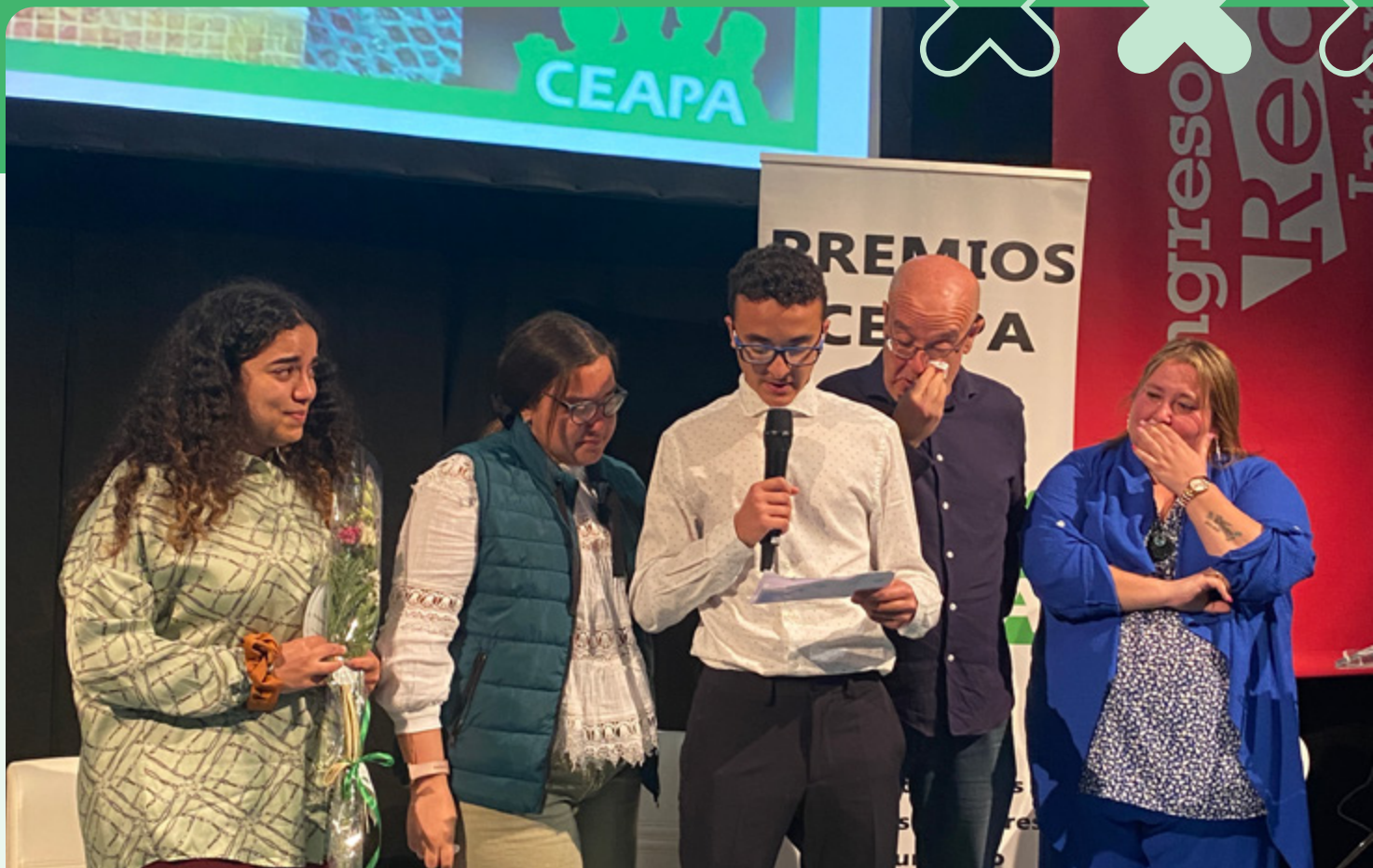
Familiares de Hamiti reciben el premio de manos de la vicepresidenta, Leticia Cardenal.